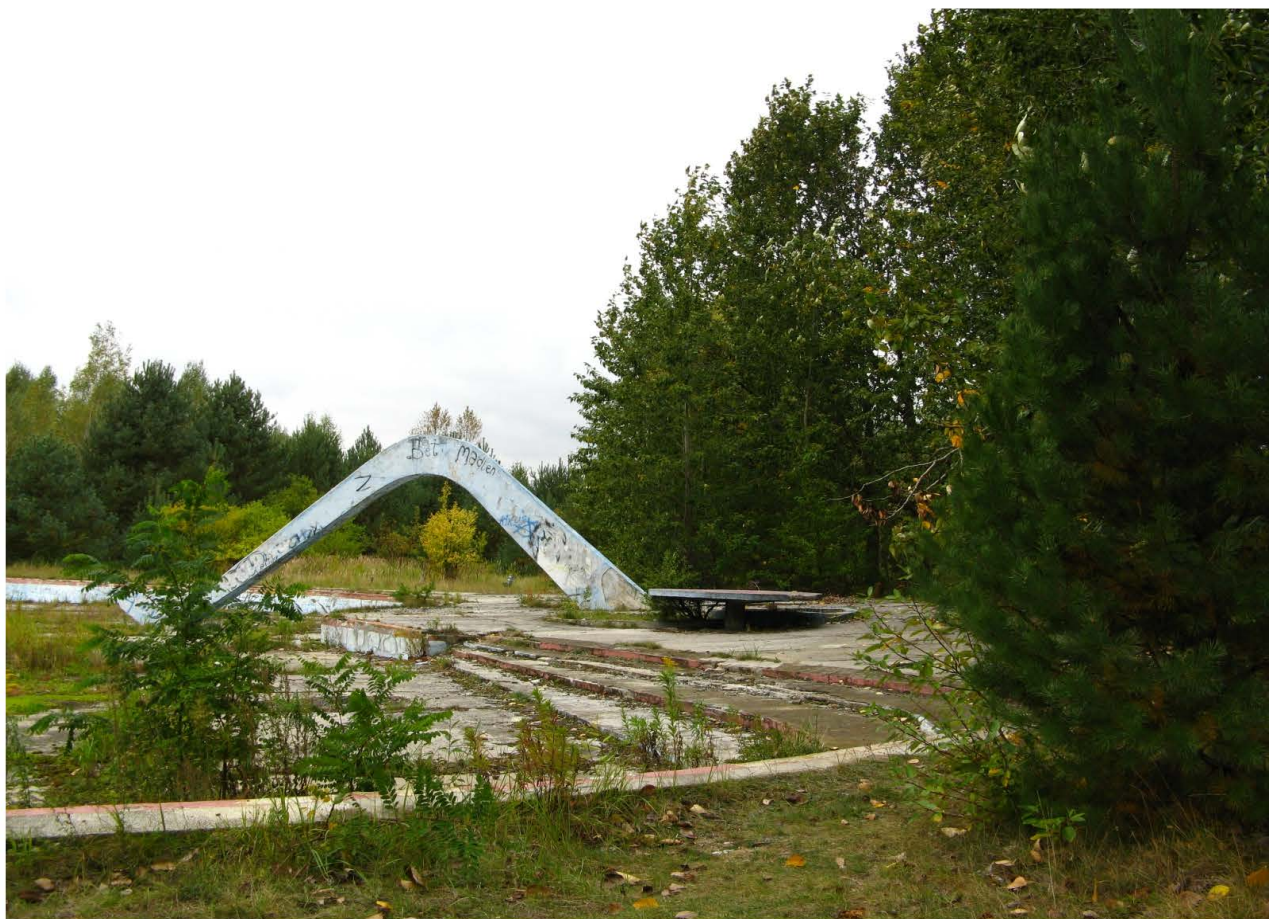
Fot. 53. Rejon dawnego Zalewu Małomickiego z niszczącymi obiektami rekreacyjnymi