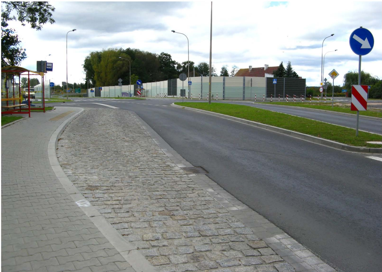
Fot. 58. Ekran akustyczny wzdłuż ul. Chocianowskiej