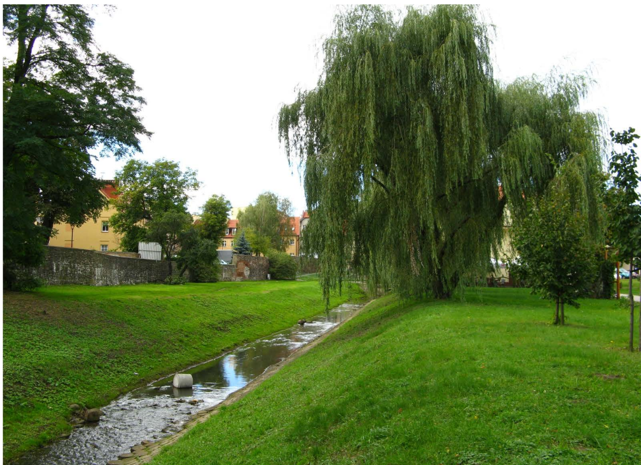
Fot. 33. Skwer Wyżykowskiego