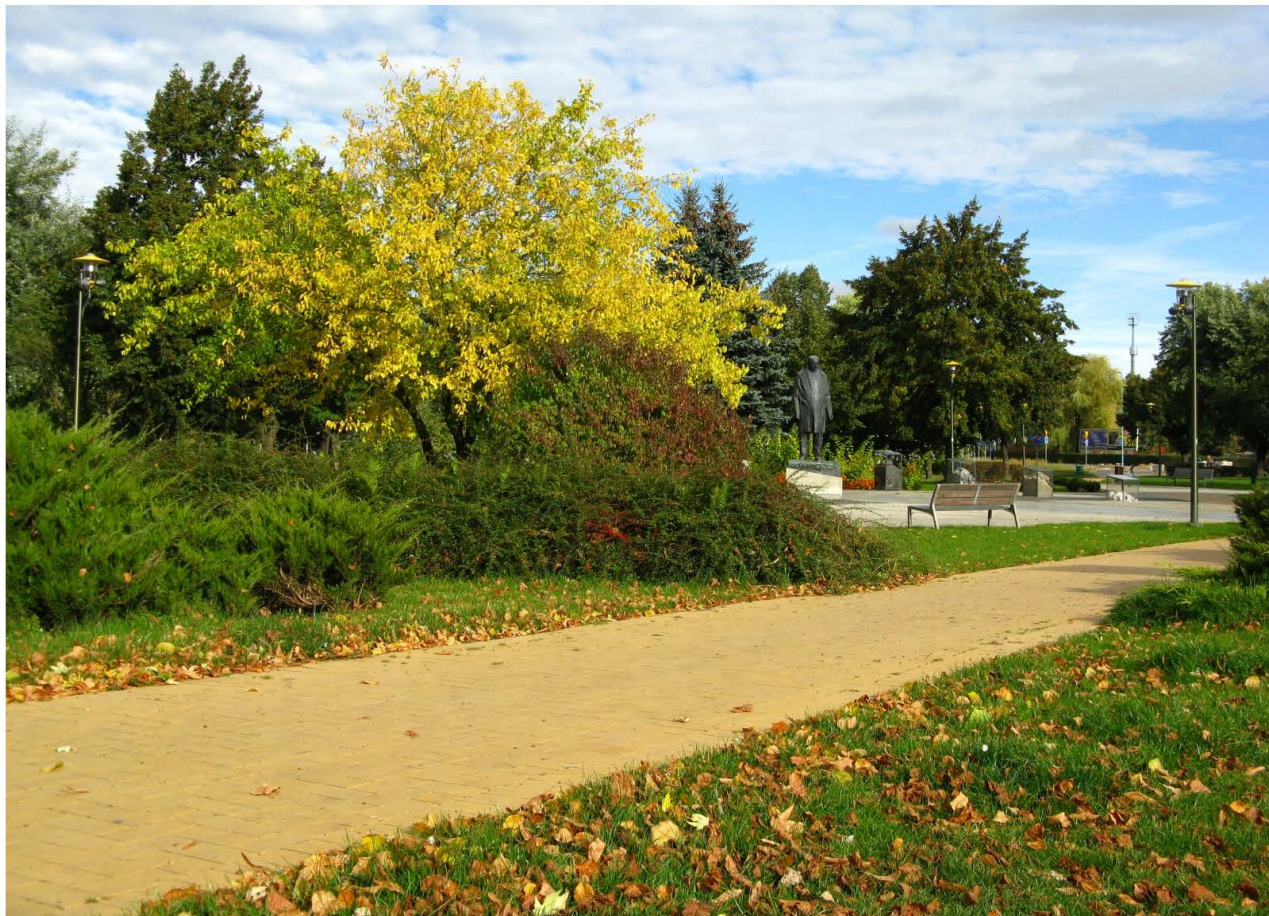
Fot. 34. Skwer Wyżykowskiego