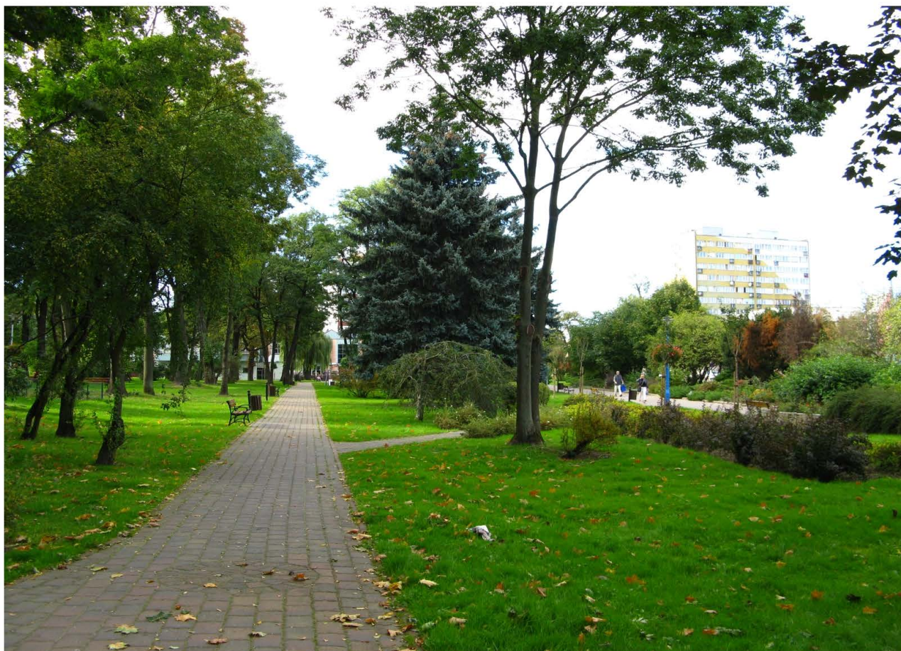
Fot. 35. Park Piłsudskiego