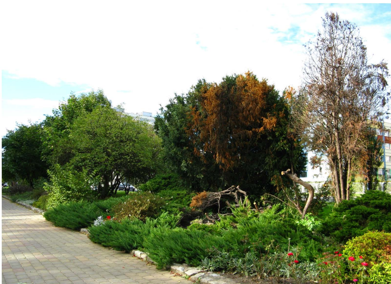
Fot. 38. Park Piłsudskiego