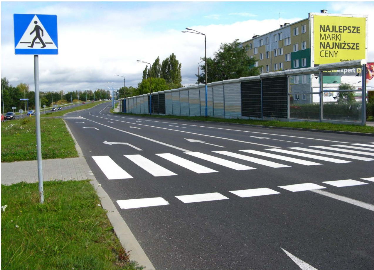
Fot. 57. Ekran akustyczny wzdłuż ul. Hutniczej