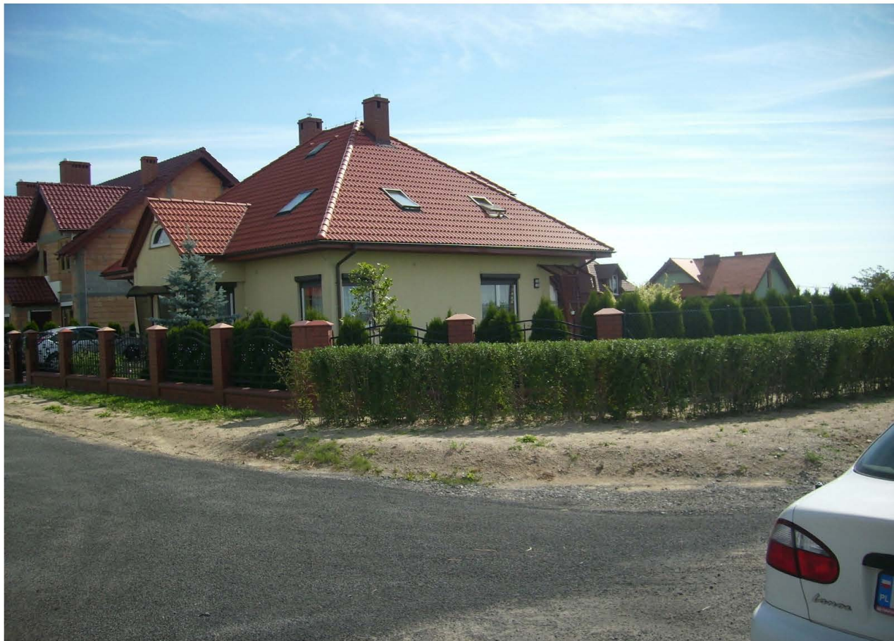
Fot. 62. Niskie emisje z indywidualnych źródeł ciepła