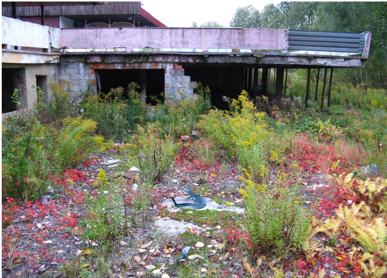
Fot. 54. Niszcząca zabudowa w sąsiedztwie dawnego Zalewu Małomickiego