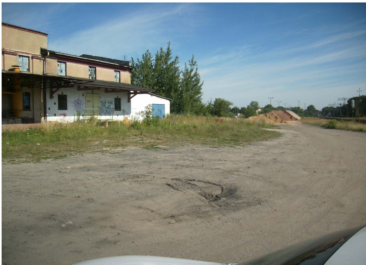
Fot. 63. Tereny przemysłowe wymagające uporządkowania