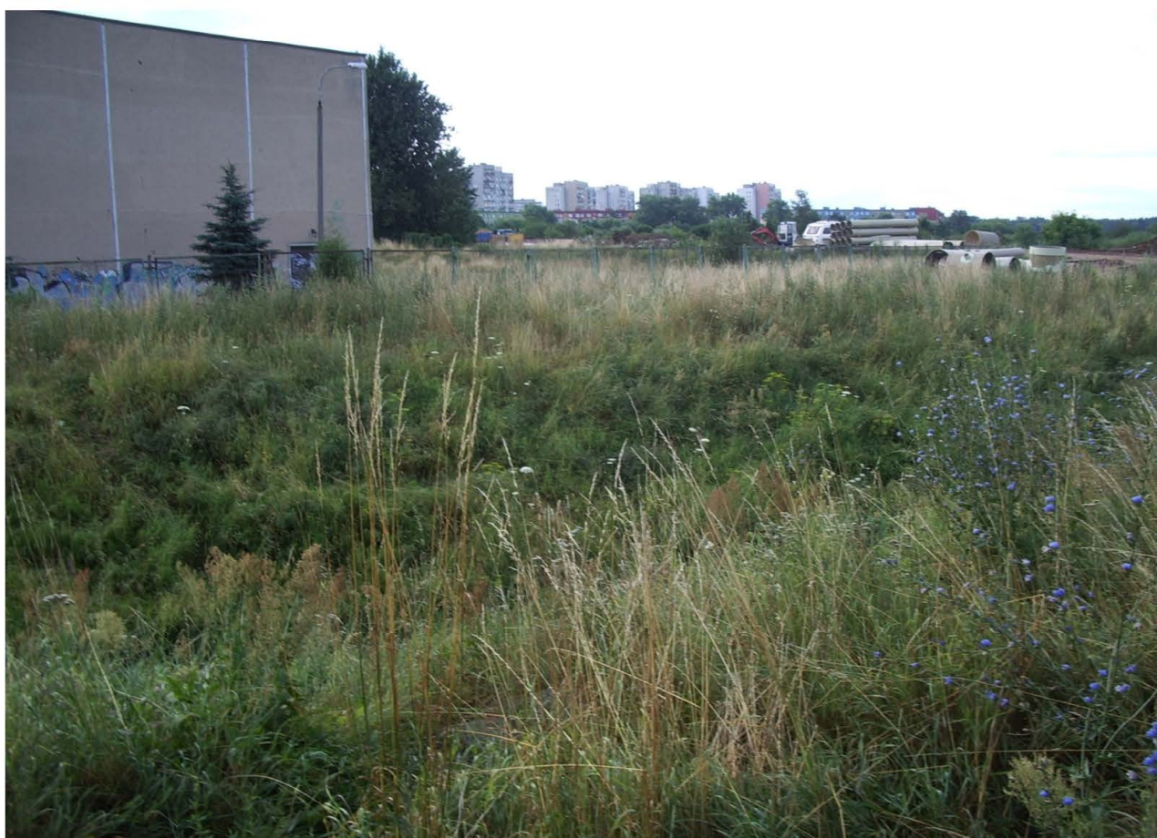
Fot. 65. Ekspansja terenów zainwestowanych