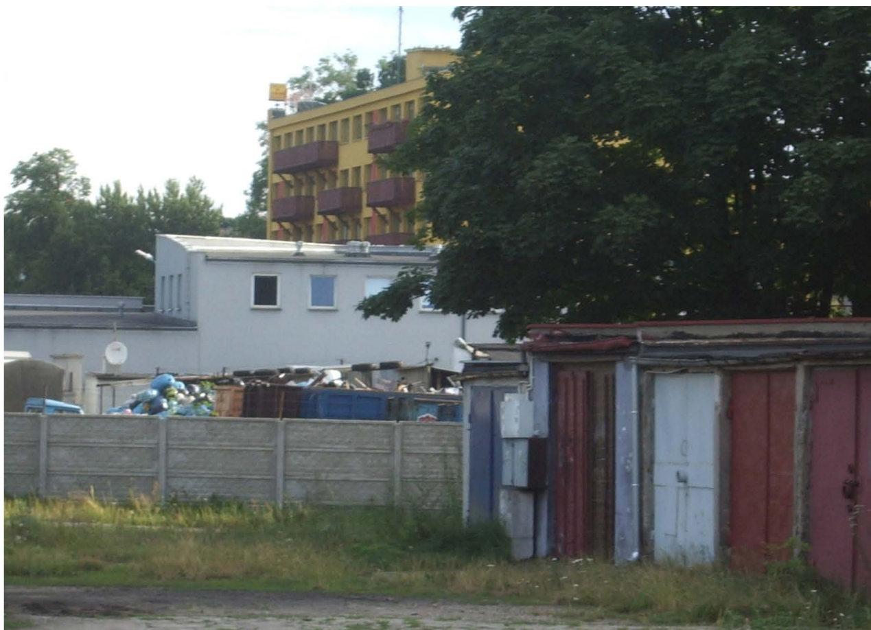
Fot. 64. Tereny substandardowego zagospodarowania wymagające uporządkowania