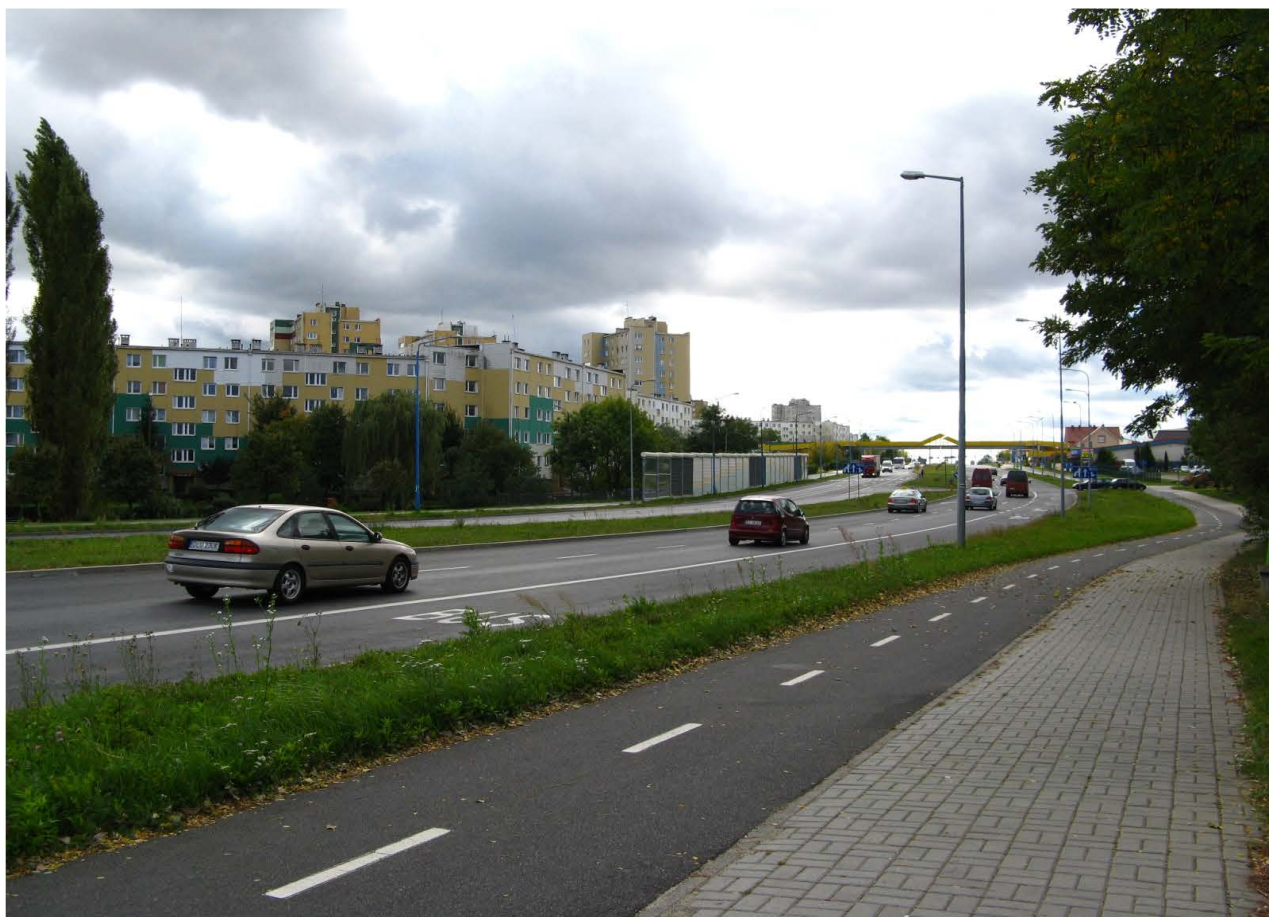
Fot. 59. Ul. Hutnicza – jedna z bardziej uciążliwych tras komunikacyjnych