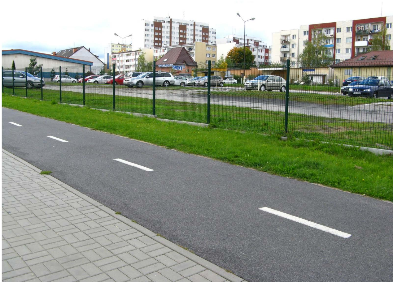
Fot. 60. Parking osiedlowy