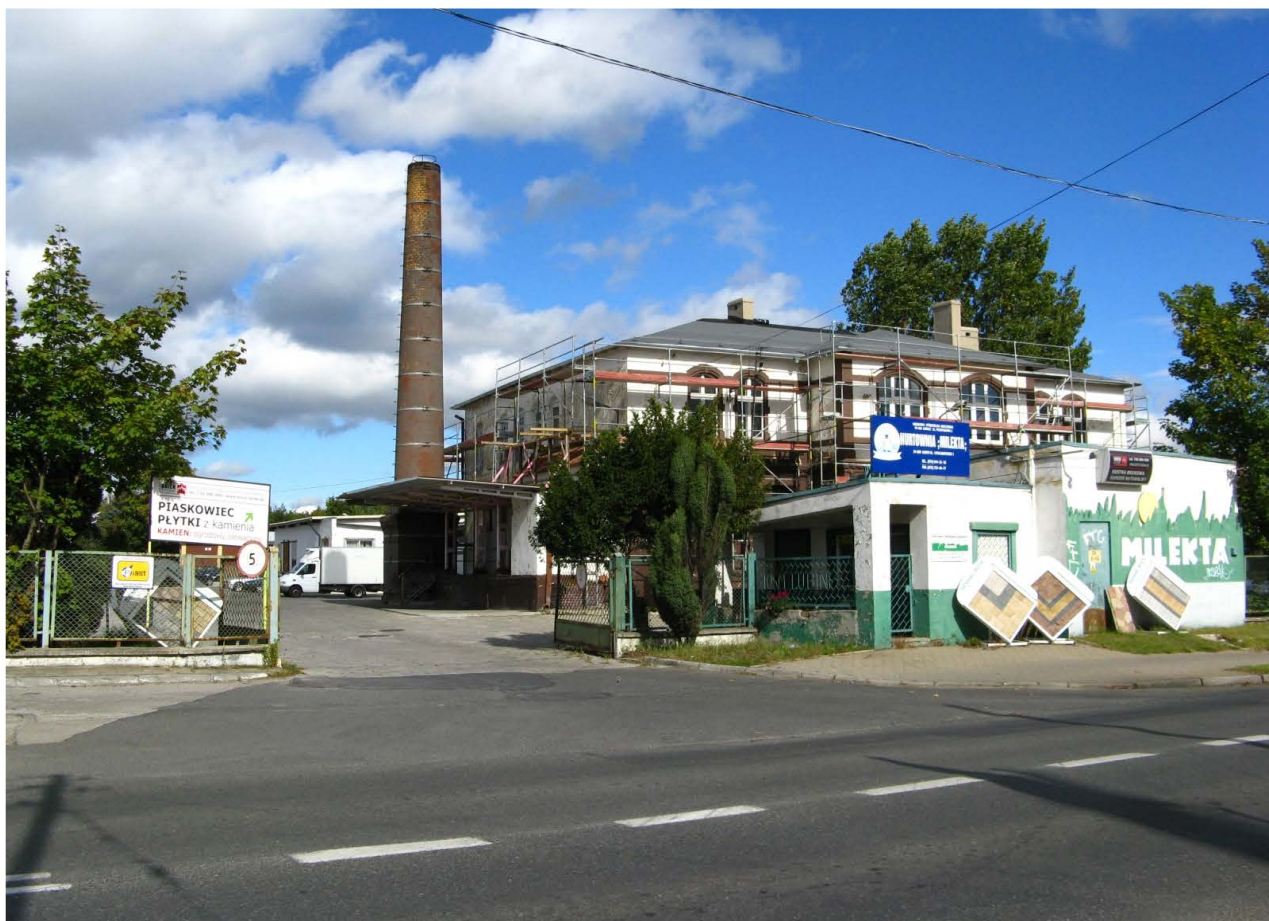
Fot. 61. Punktowe źródła emisji