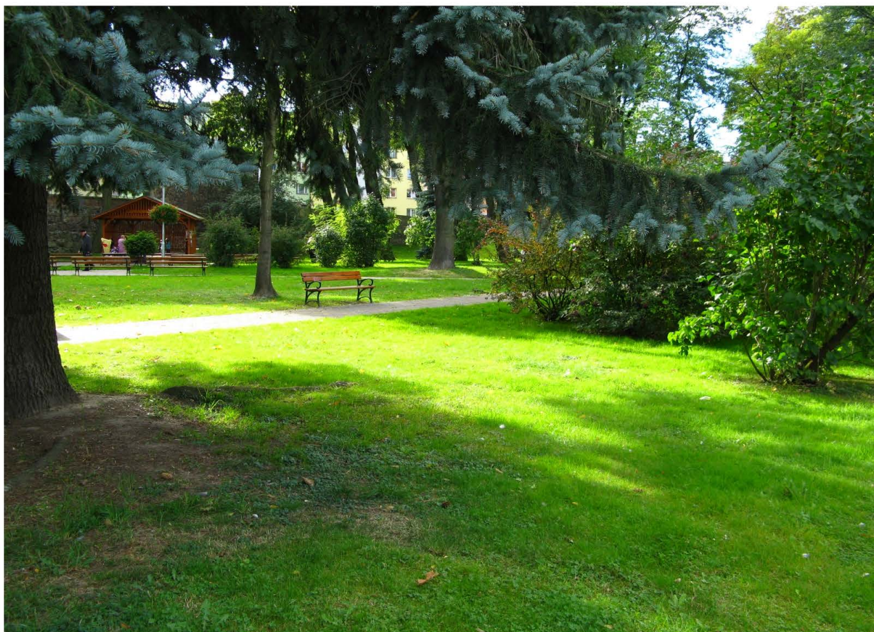
Fot. 37. Park Piłsudskiego