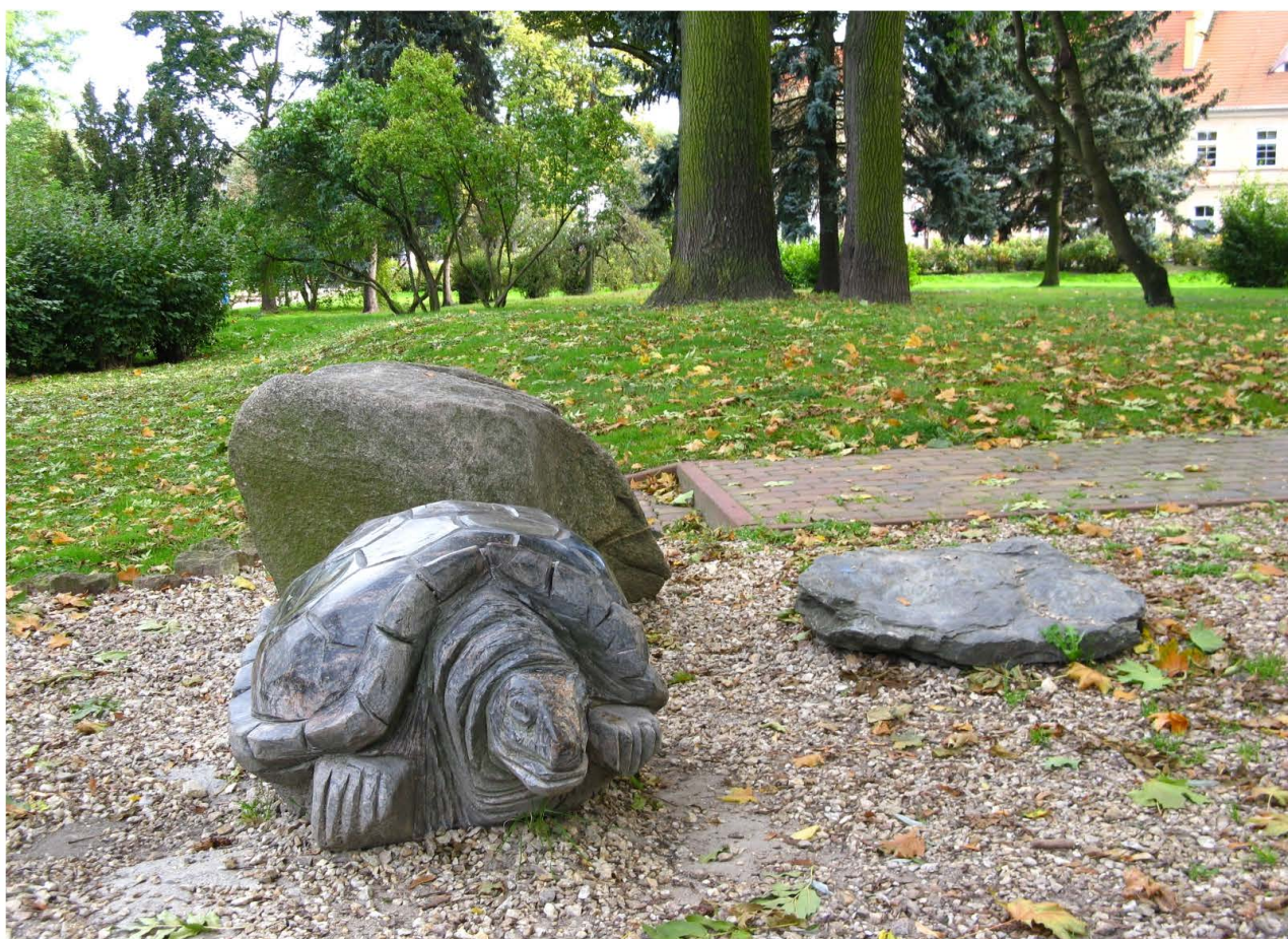
Fot. 36. Park Piłsudskiego