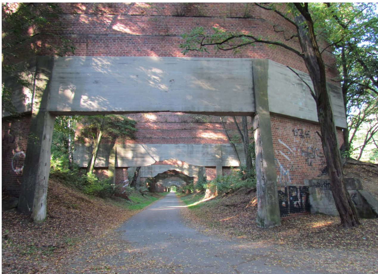
Fot. 47. Park Leśny