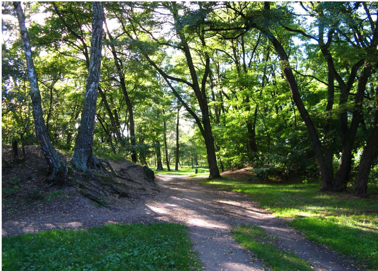
Fot. 48. Park Leśny