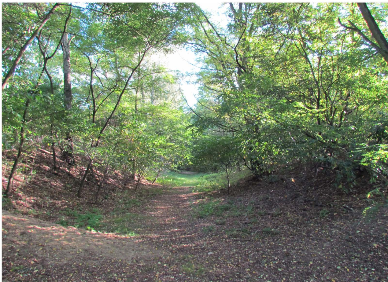
Fot. 45. Park Leśny