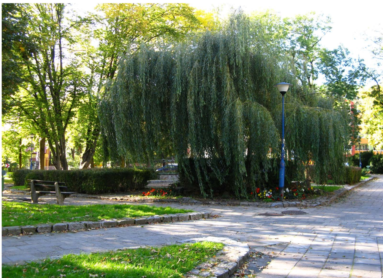
Fot. 42. Park Kopernika