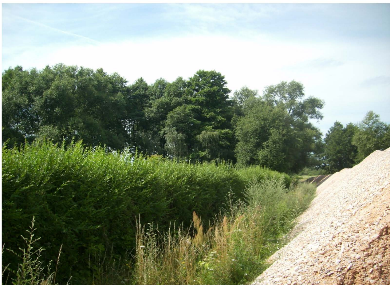
Fot. 66. Ekspansja zainwestowania – budowa drogi