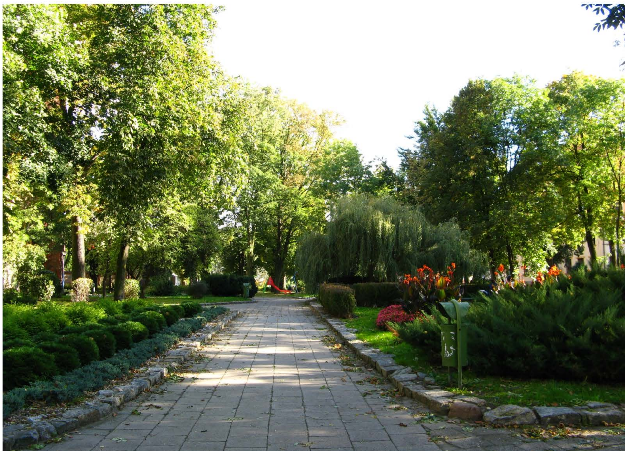
Fot. 41. Park Kopernika