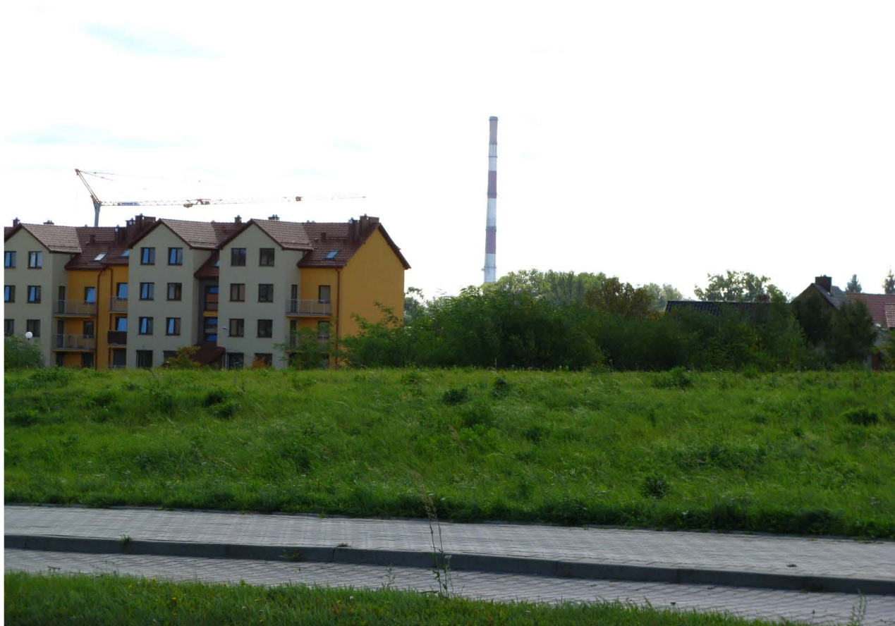
Fot. 56. Ekspansja zabudowy na dawnych terenach rolnych