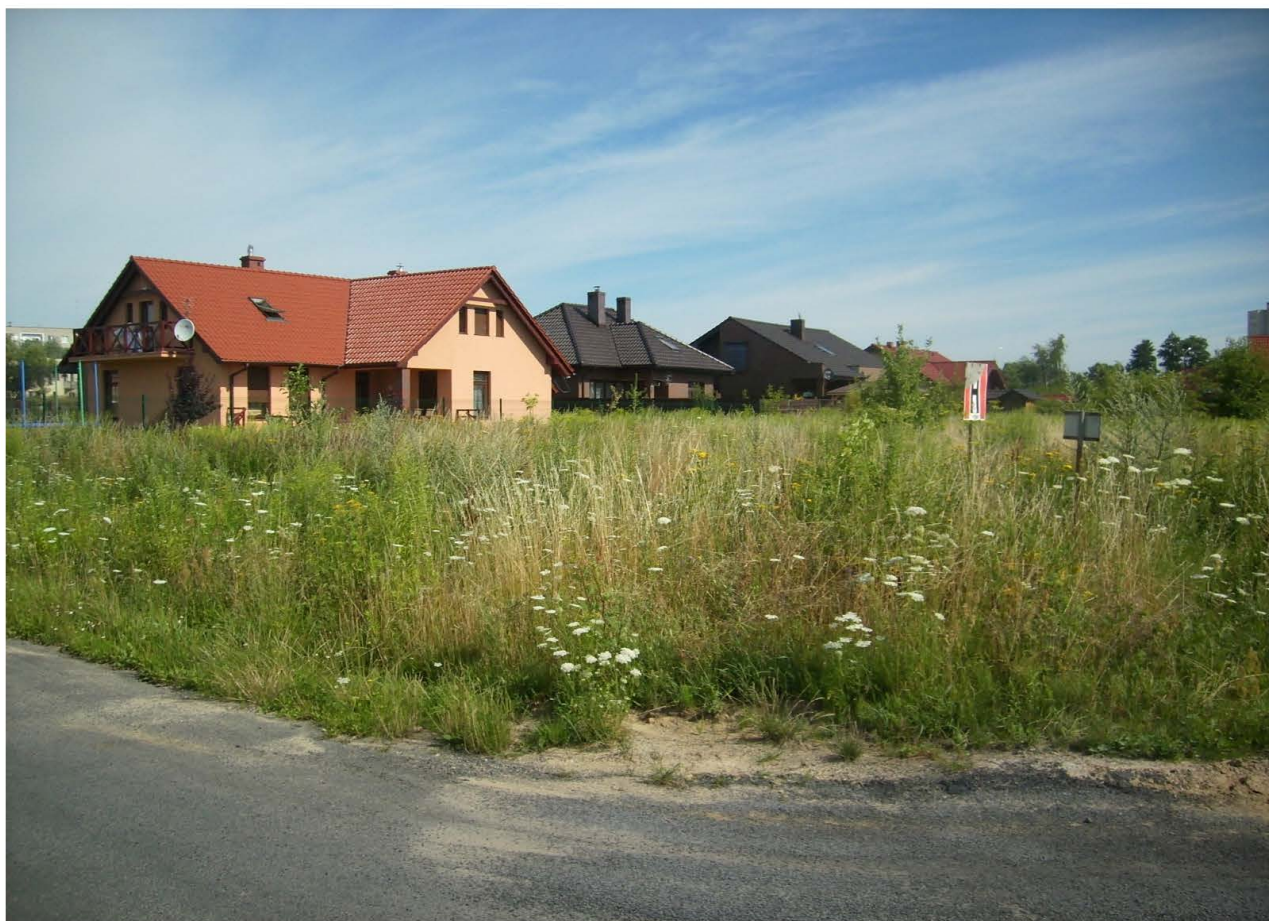
Fot. 55. Ekspansje zabudowy na tereny rolne obecnie nieuzytkowane