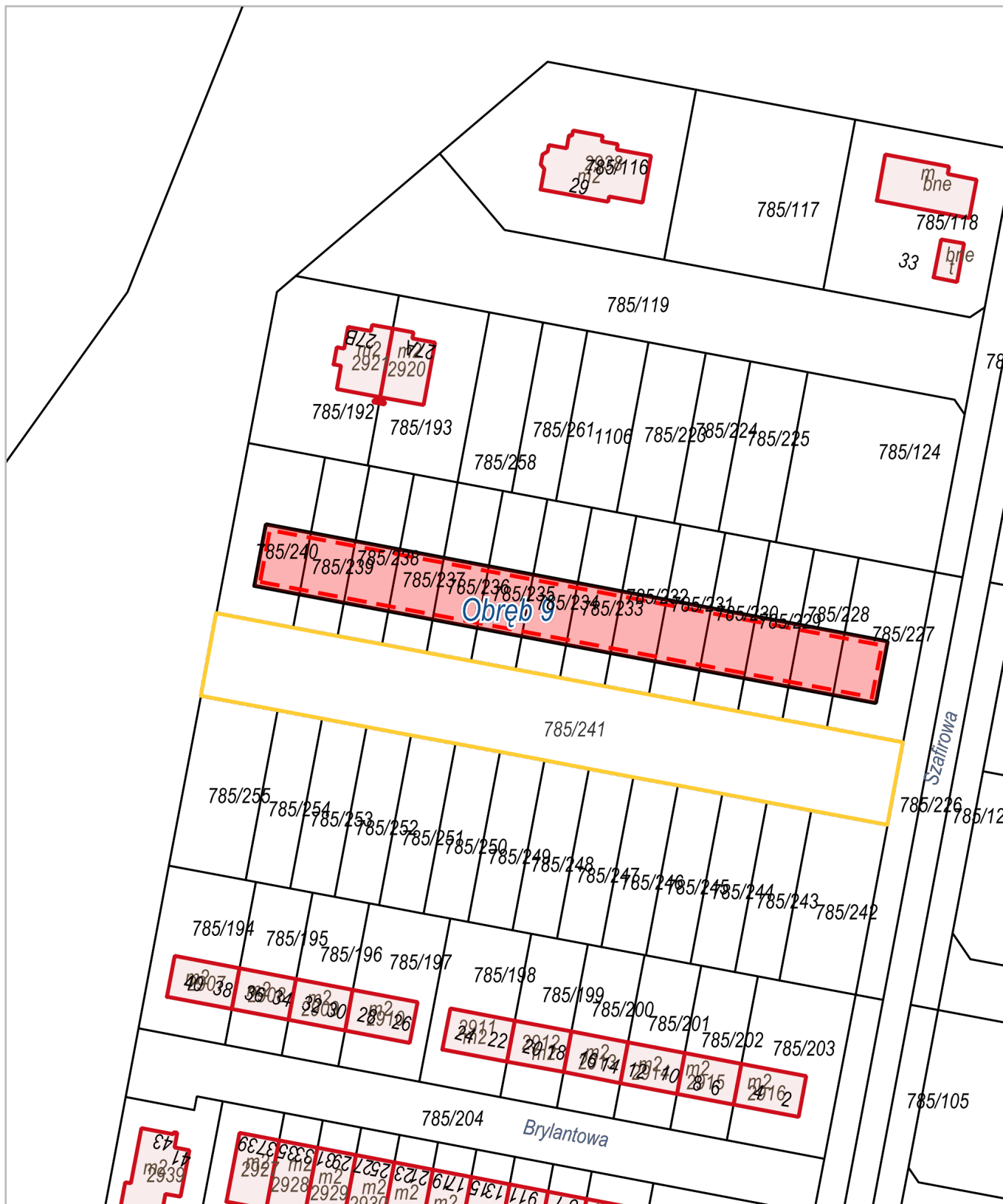
Obwód 9, Lubin (miasto)